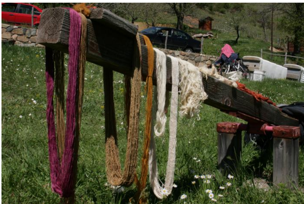
Εικόνα 21: Εργαστήριο φυτικών βαφών: τα νήματα στεγνώνουν στον ήλιο. (Εργαστήριο: Μαρία Γρηγοριάδου, Σεμινάριο: Όρια/Φύση/Υλικά, Τμήμα Εικαστικών και Εφαρμοσμένων Τεχνών του Πανεπιστημίου Δυτικής Μακεδονίας και το Κέντρο Περιβαλλοντικής Εκπαίδευσης Μελίτης, 2011)

Παραγωγή: Συλλέγονται φυτικές ίνες που υπάρχουν στο περιβάλλον της περιοχής και μπορούν να χρησιμοποιηθούν για βαφή. Κατασκευάζονται όσα χρώματα είναι δυνατόν. Χρωματίζονται οι κατασκευές τσόχας της προηγούμενης άσκησης.