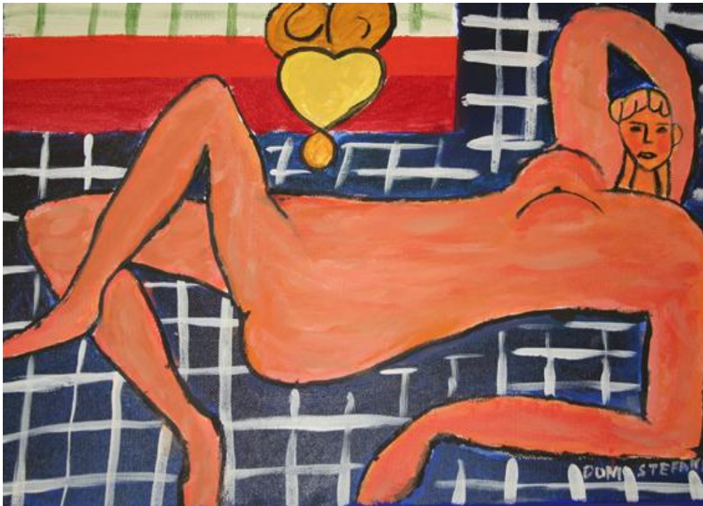
Εικόνα 15: Έργο εκπαιδευομένου, Σ.Δ.Ε. Φυλακών Κορυδαλλού.