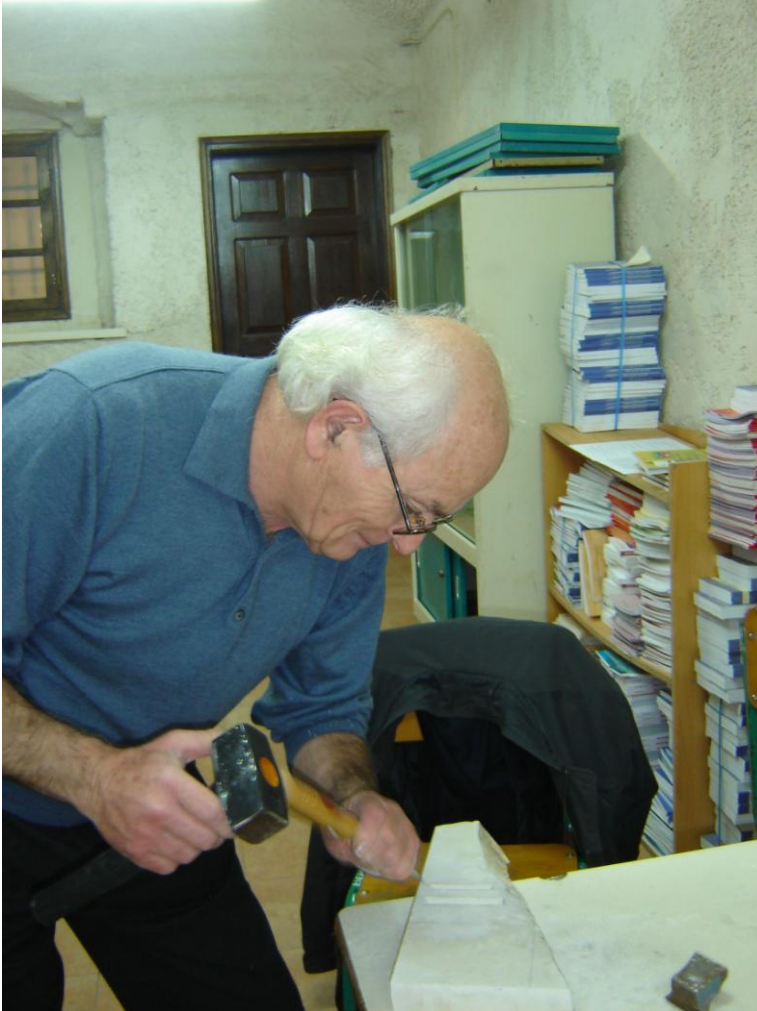
Εικόνα 10: Εργαστήρι Γλυπτικής, Σ.Δ.Ε. Χανίων, 2007-2008