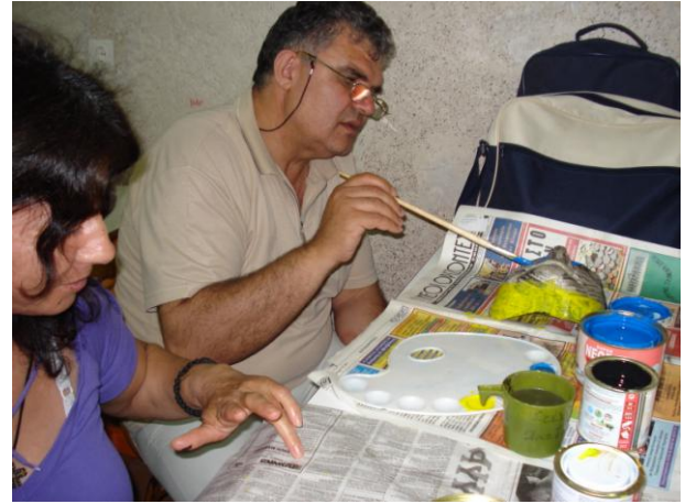
Εικόνα 6: Εργαστήριο κατασκευής μάσκας. Σ.Δ.Ε. Χανίων 2007-2008