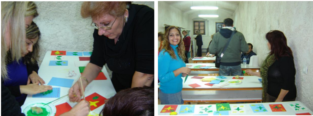
Εικόνα 11: Χριστουγεννιάτικες κάρτες, Σ.Δ.Ε. Χανίων, 2007-2008.