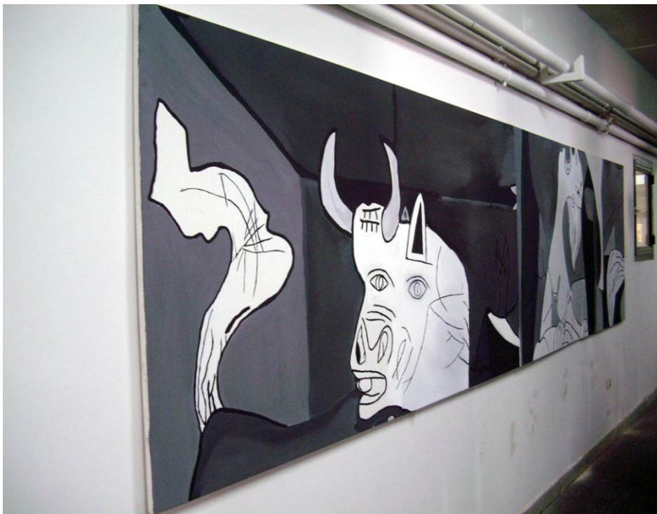
Εικόνα 13: Έργα των εκπαιδευομένων βασισμένα στη Γκερνίκα του Picasso. Σ.Δ.Ε. Φυλακίων Κορυδαλλού 2006-2007.