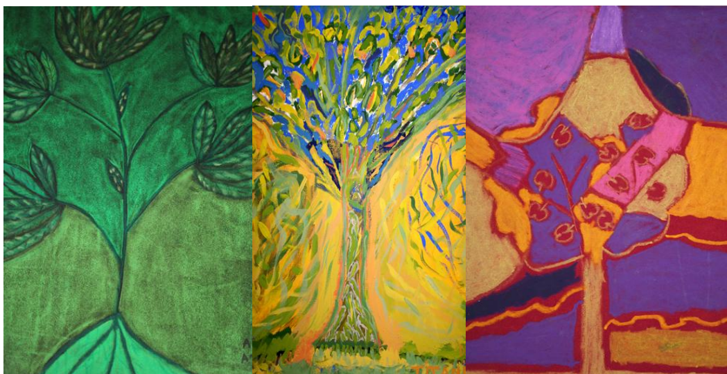
Εικόνα 14: Έργα των εκπαιδευομένων, Σ.Δ.Ε. Φυλακών Κορυδαλλού, 2006-2007.