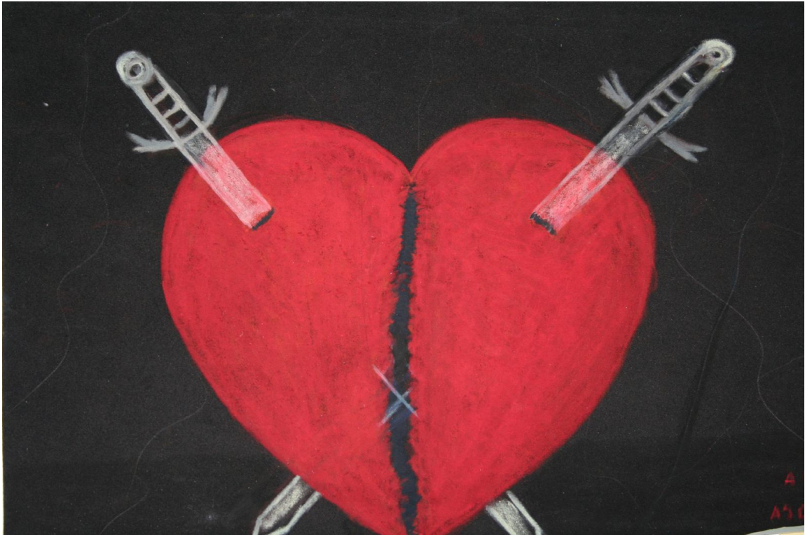
Εικόνα 17: Έργα των εκπαιδευομένων, Σ.Δ.Ε. Φυλακών Κορυδαλλού