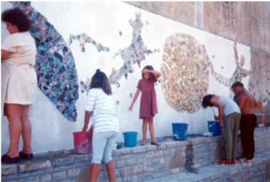
Εικόνα 27: Η πτόση του Ίκαρου, κεραμική τοιχογραφία, 2,5x35m, 1995-2000. Η διαδικασία κατασκευής της κεραμικής τοιχογραφίας στην Σάμο. Τα κεραμικά πλακίδια επικολλώνται στον τοίχο ο οποίος σφραγίζεται. Η επιλογή της θεματολογίας έχει να κάνει με τον τόπο και το Ικάριο Πέλαγος που βρίσκεται ακριβώς απέναντι από το παραθαλάσσιο χωριό του Αγίου Κωνσταντίνου

Στόχοι: να ολοκληρωθεί η διαδικασία με την τοποθέτηση των κεραμικών πλακιδίων στην επιφάνεια στον δημόσιο χώρο.