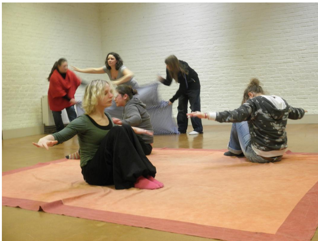
Εικόνα 1 Μουσικοκινητική δράση βασισμένη στη μέθοδο Dalcroze, Ερευνητικό Πρόγραμμα « Créer par le corps - créer par le rythme. Une démarche artistique pour la pédagogie », Πανεπιστήμιο Κρήτης / Institut de Rythmique Jaques-Dalcroze , Βρυξέλλες 2010.