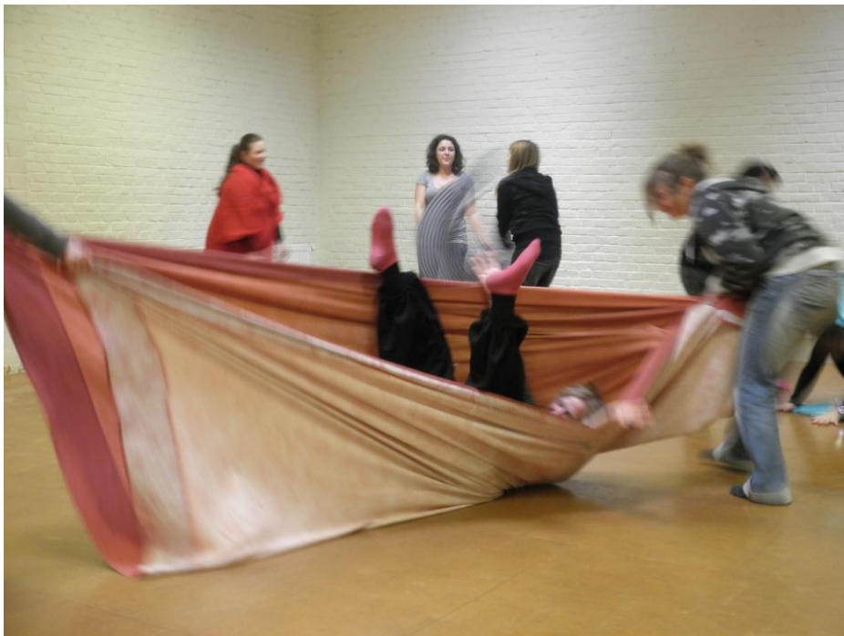
Εικόνα 3: Μουσικοκινητική δράση βασισμένη στη μέθοδο Dalcroze. Ερευνητικό Πρόγραμμα « Créer par le corps - créer par le rythme. Une démarche artistique pour la pédagogie », Πανεπιστήμιο Κρήτης / Institut de Rythmique Jaques-Dalcroze, Βρυξέλλες 2010.