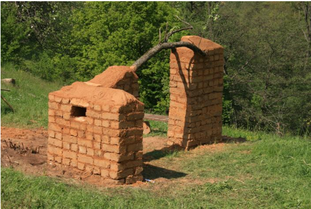
Εικόνα 25: Εργαστήριο Πλιθιών: πάνω: κτίζοντας το πορτόνι στην Δροσοπηγή, Φλώρινα. Κάτω: το Πορτόνι (Εργαστήριο: Αγγέλα Γεωργαντά, Σεμινάριο: Όρια/Φύση/Υλικά, Τμήμα Εικαστικών και Εφαρμοσμένων Τεχνών του Πανεπιστήμιου Δυτικής Μακεδονίας και το Κέντρο Περιβαλλοντικής Εκπαίδευσης Μελίτης, 2011).