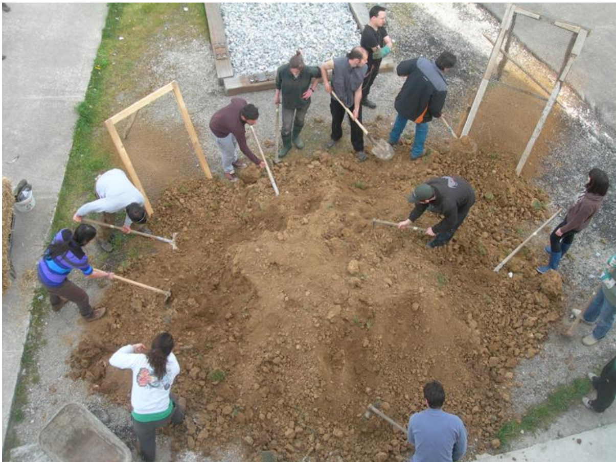
Εικόνα 24: Εργαστήριο Πλιθιών: το κοσκίνισμα του χώματος (Εργαστήριο: Αγγέλα Γεωργαντά, Σεμινάριο: Όρια/Φύση/Υλικά, Τμήμα Εικαστικών και Εφαρμοσμένων Τεχνών του Πανεπιστημίου Δυτικής Μακεδονίας και το Κέντρο Περιβαλλοντικής Εκπαίδευσης Μελίτης, 2011).

Στάδιο εμπλουτισμού: α) Επίσκεψη σε σπίτια της περιοχής που έχουν κατασκευαστεί από πλιθιά β) προβολή ντοκιμαντέρ για τους τρόπους κατασκευής σπιτιών από πλιθιά και τα οικολογικά και ενεργειακά πλεονεκτήματα αυτών των κατασκευών.