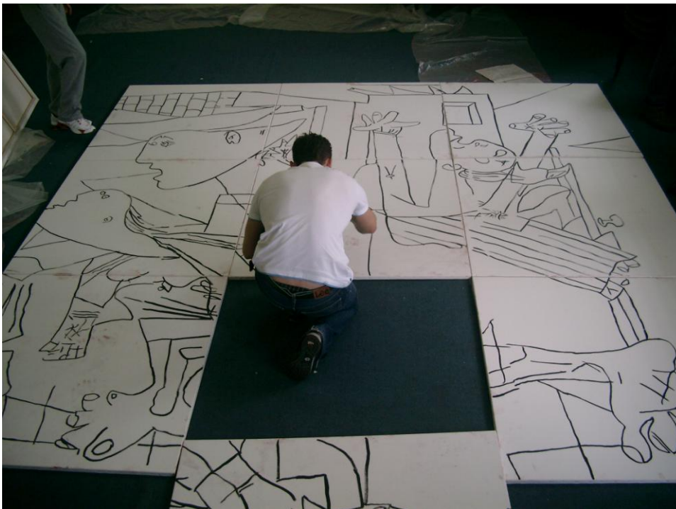
Εικόνα 4: Σ.Δ.Ε. Φυλακών Κορνδαλλού, 2006-2007

Οι «όροι» αυτοί, αφού παρουσιαστούν, συζητηθούν και εμπλουτιστούν, συγκεντρώνονται σε έναν ενιαίο κατάλογο, είτε σε χαρτί του μέτρου, είτε σε πίνακα, ο οποίος αναρτάται σε εμφανές σημείο μέσα στην αίθουσα διδασκαλίας. Κάποιος/α καλλιγράφος από τους/τις εκπαιδευόμενους/ες θα μπορούσε να αναλάβει να τον καθαρογράψει ή κάποιος/α εξοικειωμένος με τη δημιουργία ψηφιακών εντύπων θα μπορούσε να προθυμοποιηθεί να τον εκτυπώσει σε μεγάλων διαστάσεων χαρτόνι. Στον κατάλογο αυτό μπορούμε να ανατρέχουμε κάθε φορά που κάποιος όρος του συμβολαίου αθετείται.