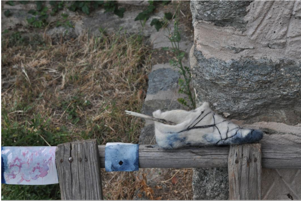
Εικόνα 18: Παντόφλα από τσόχα. Η κατασκευή αναπαράγει τον αρχαίο μύθο ότι η πρώτη τσόχα δημιουργήθηκε όταν ένα μοναχός τύλιξε τα πόδια του με μαλλί για να τα προφυλάξει από τα ξυλοπάπουτσα ενώ βιάδιζε. Ο ιδρώτας και η τριβή δημιούργησαν την πρώτη τσόχα, το πρώτο παπούτσι από τσόχα (Εργαστήριο: Γεωργία Γκρεμούτη, Εικαστική Πορεία προς τις Πρέσπες, Τμήμα Εικαστικών και Εφαρμοσμένων Τεχνών, Πανεπιστήμιο Δυτικής Μακεδονίας, 2011)

Στόχοι: α) να γίνουν κατανοητές οι δυνατότητες του μαλλιού ως υλικού β) να συνειδητοποιηθούν οι ιδιαίτερες φόρμες που μπορούν να κατασκευαστούν με το υλικό αυτό γ) να ενημερωθούν οι εκπαιδευόμενοι/ες για τους παραδοσιακούς τρόπους χρήσης της τσόχας.