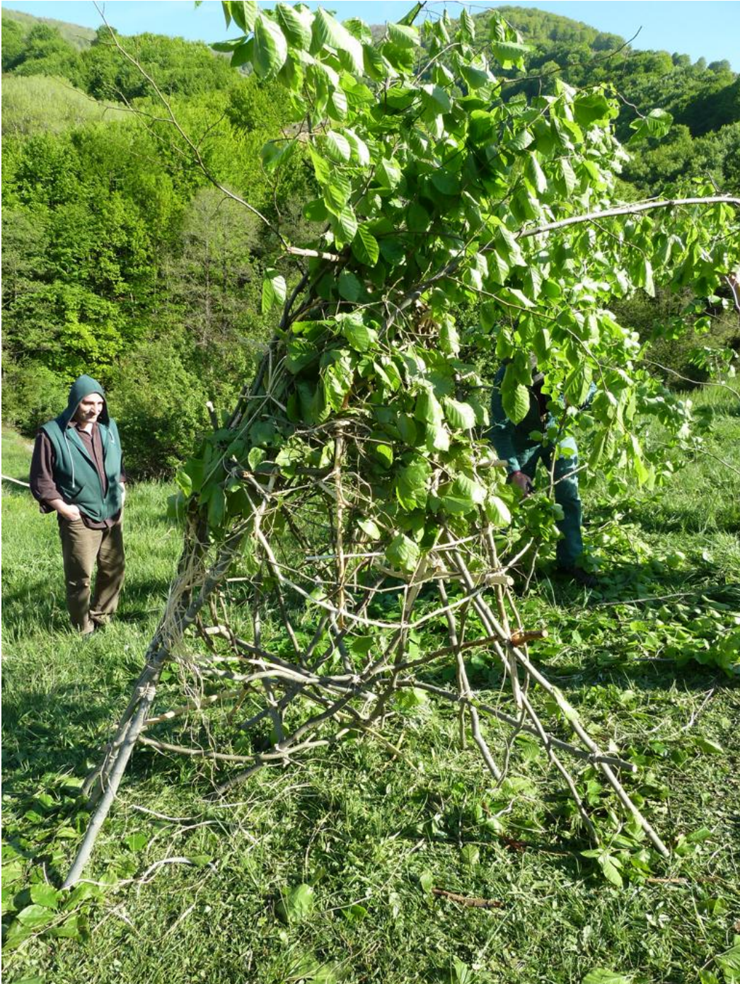
Εικόνα 23: Εργαστήριο Κλαδιών: γλυπτική κατασκευή με κλαδιά (Εργαστήριο: Ακης Γκούμας, Σεμινάριο: Ορια/Φύση/Υλικά, Τμήμα Εικαστικών και Εφαρμοσμένων Τεχνών του Πανεπιστημίου Δυτικής Μακεδονίας και το Κέντρο Περιβαλλοντικής Εκπαίδευσης Μελίτης, 2011).

Παραγωγή: με σχετική άδεια του τοπικού δασαρχείου συλλέγονται κλαδιά από την περιοχή, κατά προτίμηση από εκείνα που βρίσκονται στο χόμα. Συγκεντρώνονται σε ένα σημείο όπου δημιουργούνται ως συλλογικό έργο δύο κατασκευές: μια χρηστική κατασκευή και ένα γλυπτό. Με αυτό τον τρόπο οι εκπαιδευόμενοι εξοικειώνονται και με τις δύο κατευθύνσεις της δυνατότητας του υλικού: την χρηστική και την εκφραστική.