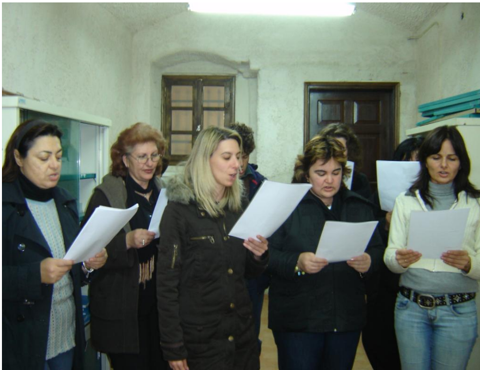
Εικόνα 8: Εκπαιδευόμενες του Σ.Δ.Ε. Χανίων ψάλλουν τα κάλαντα σε διάφορες γλώσσες, 2007-2008.