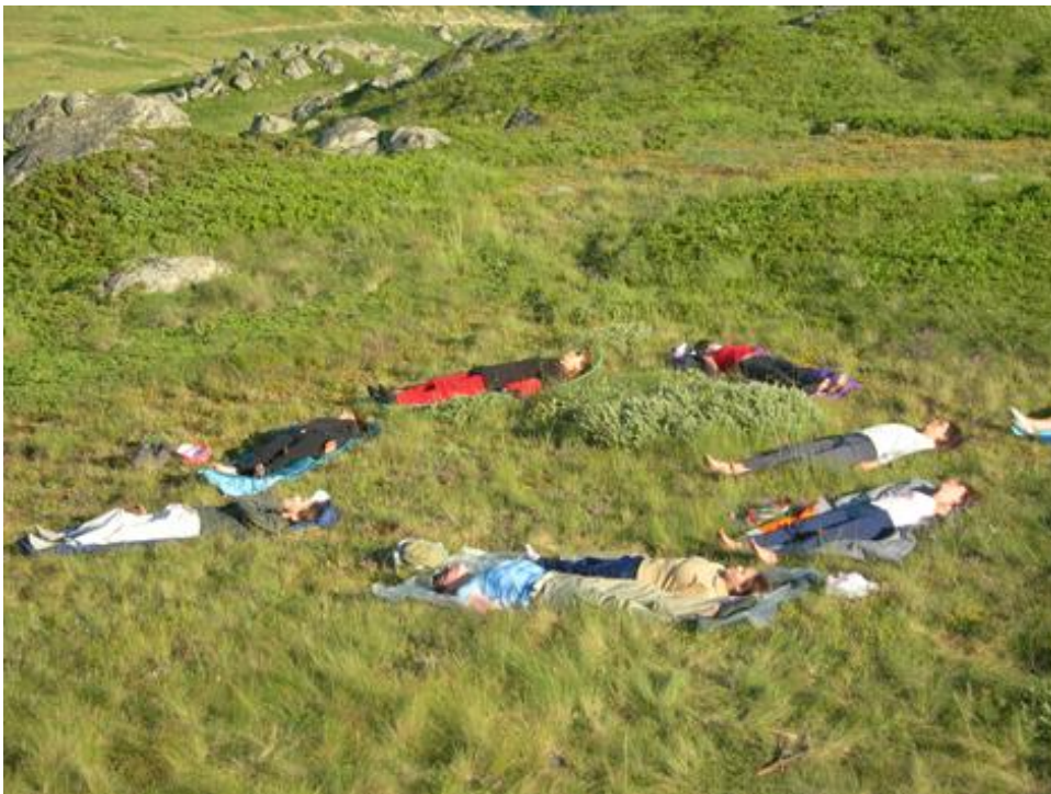
Εικόνα 2 Το σώμα ακουμπά τη Φύση και συναισθάνεται τον χώρο κυρίως όμως την ύλη που το σχηματίζει. Η εμπειρία της φύσης δεν είναι μόνο εκείνη της ενατένισης αλλά εκείνης της βίωσης της πραγματικής της διάστασης. Αντίστοιχα και το έργο τέχνης δεν βρίσκεται απέναντι μας αλλά βιώνεται ως μέρος της δικής μας, ατομικής, εμπειρίας, αλλιώς δεν υπάρχει (Εικαστική Πορεία προς τις Πρέσπες, Τμήμα Εικαστικών και Εφαρμοσμένων Τεχνών, Πανεπιστήμιο Δυτικής Μακεδονίας, 2007).

Επομένως το ενδιαφέρον μετατοπίζεται από το αντικείμενο και στον ερωτώμενο. Το αντικείμενο, η μοντέρνα τέχνη, η έντεχνη δημιουργία, προσλαμβάνεται μόνο αν ενεργοποιηθούν σχεσιακές διαδικασίες που εμπλέκουν τον θεατή και, στην περίπτωση της καλλιτεχνικής εκπαίδευσης τον/ην εκπαιδευόμενο/η. Αυτή η μετατόπιση αποτελεί και ένα δομικό στοιχείο της σύγχρονης Αισθητικής Αγωγής. Η εμπειρία του θεατή και ακολούθως και του/της εκπαιδευόμενου/ης και όχι το καθεαυτό αντικείμενο καθίσταται κεντρικό στοιχείο της εκπαιδευτικής διαδικασίας. Η αισθητική εμπειρία συμβάλλει στην απόκτηση της ικανότητας να ξεχωρίζουμε το αισθητικά ωραίο ή ενδιαφέρον από το μη, να προβαίνουμε, επομένως σε αξιολογικές κρίσεις. Αναζητούμε στις αισθητικές ή άλλες αξίες τα γνωρίσματα της αισθητικής λειτουργίας που μας φέρνουν σε επαφή με τη συγκίνηση, τη γαλήνη, την αρμονία, την οδύνη, την ομοιογένεια της αισθητικής εμπειρίας, η οποία μας οδηγεί εν τέλει στο καλλιτεχνικά αξιόλογο.