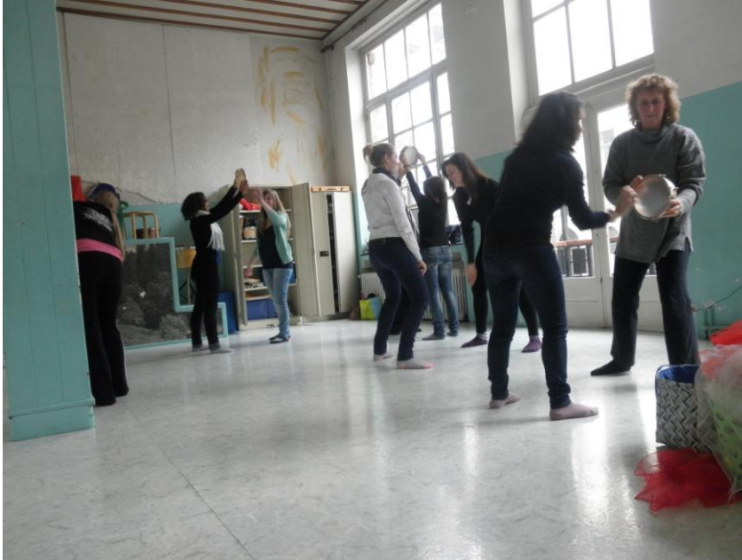
Εικόνα 9: Μουσικοκινητική δράση με ντέφια, βασισμένη στη μέθοδο Dalcroze, Ερευνητικό Πρόγραμμα « Créer par le corps - créer par le rythme. Une démarche artistique pour la pédagogie », Πανεπιστήμιο Κρήτης / Institut de Rythmique Jaques- Dalcroze, Βρυξέλλες 2010.