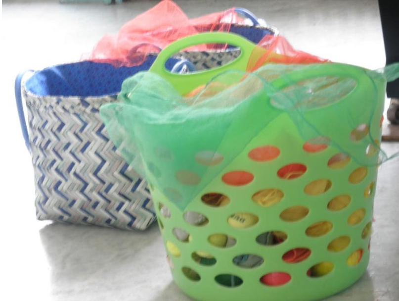
Εικόνα 7: Χρήσιμα «άχρηστα» υλικά για τις ανάγκες της Θεατρικής Αγωγής.