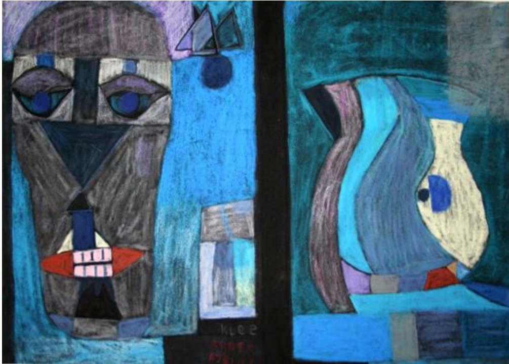
Εικόνα 16: Έργα των εκπαιδευομένων, Σ.Δ.Ε. Φυλακών Κορδαλλού