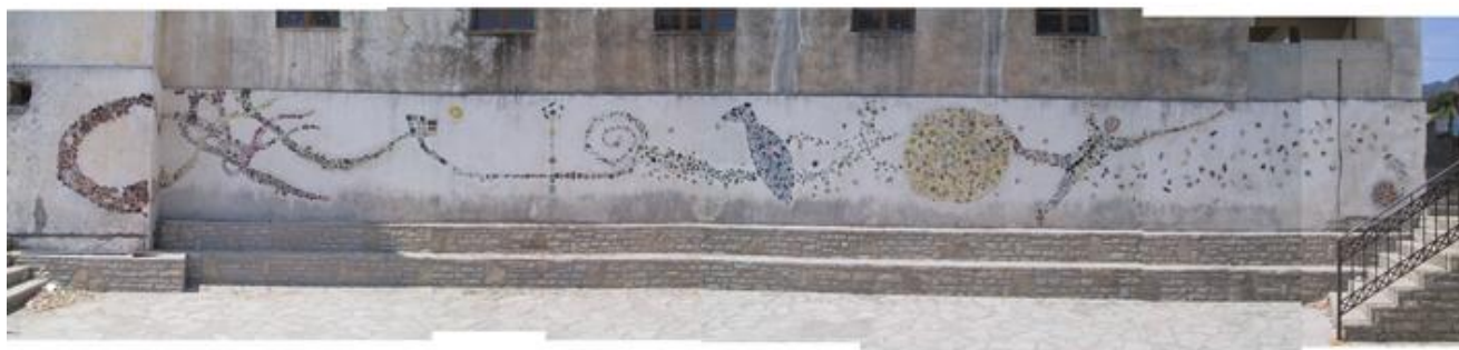
Εικόνα 26: Η πτόση του Ίκαρου, κεραμική τοιχογραφία, 2,5x35m, 1995-2000.

(Επάνω) Το εικαστικό έργο λειτουργεί ως χώρος κοινωνικής παρέμβασης και μετασχηματισμού του δημόσιου χώρου. Ο χώρος συνολικά μετασχηματίζεται, δημιουργείται μια πλατεία γύρω από την τοιχογραφία και το σχολείο ανακαινίζεται. (Κάτω) το έργο στην πλήρη του ανάπτυξη.