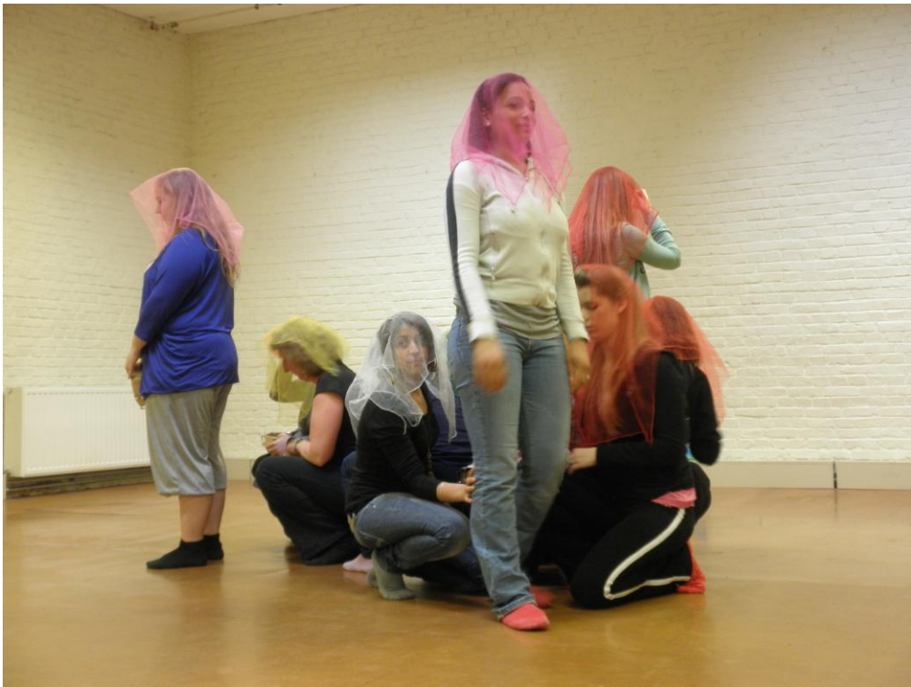
Εικόνα 5: Μουσικοκινητική δράση βασισμένη στη μέθοδο Dalcroze, Ερευνητικό Πρόγραμμα « Créer par le corps - créer par le rythme. Une démarche artistique pour la pédagogie », Πανεπιστήμιο Κρήτης / Institut de Rythmique Jaques-Dalcroze, Βρυξέλλες 2010.